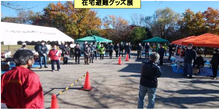
在宅避難グッズ展