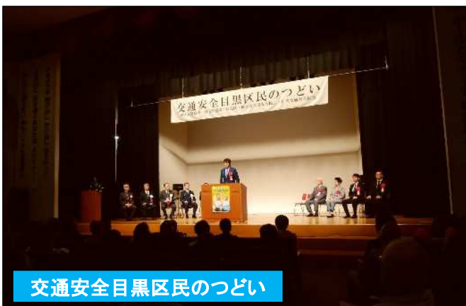
交通安全目黒区民のつどい