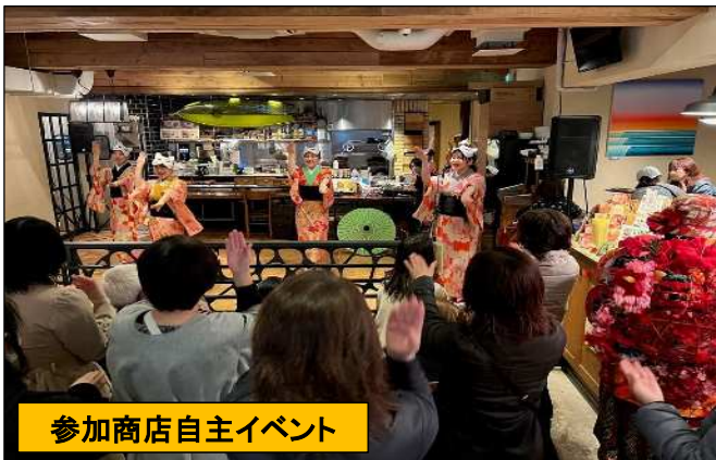
参加商店自主イベント