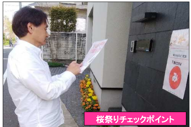
桜祭りチェックポイント