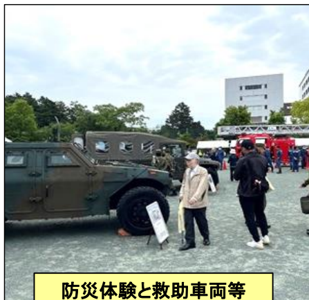
防災体験と救助車両等