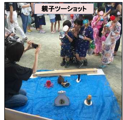
親子ツーショット