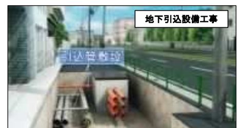
地下引込設備工事