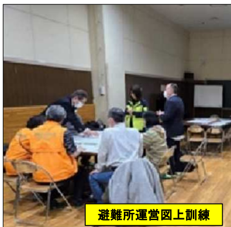
避難所運営図上訓練